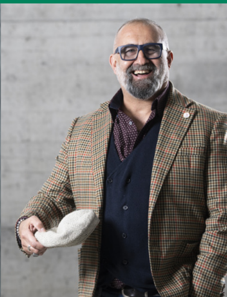
8. Capulli Mandricardo 1964